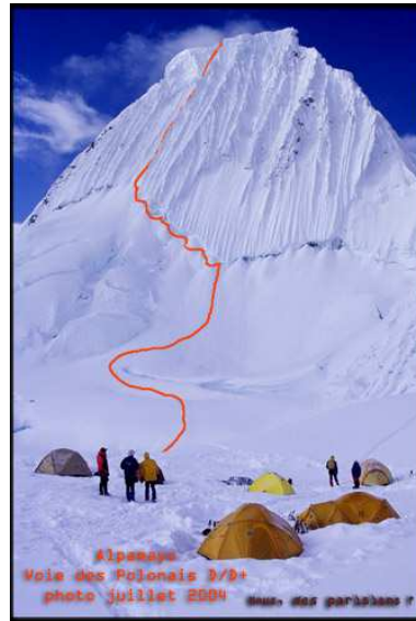
Vue sur la face Ouest de l'alpamayo depuis le camp d'altitude