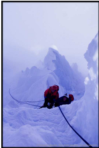
Dans une Iceflute de l'Alpamayo