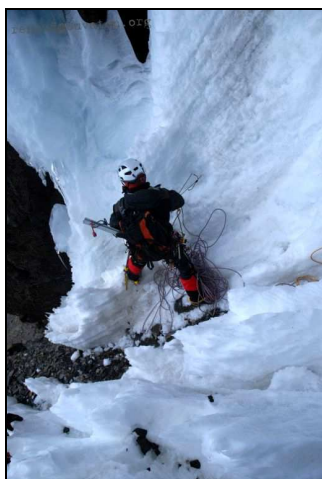
Relais dans les pénitents de la Cordillère royale.