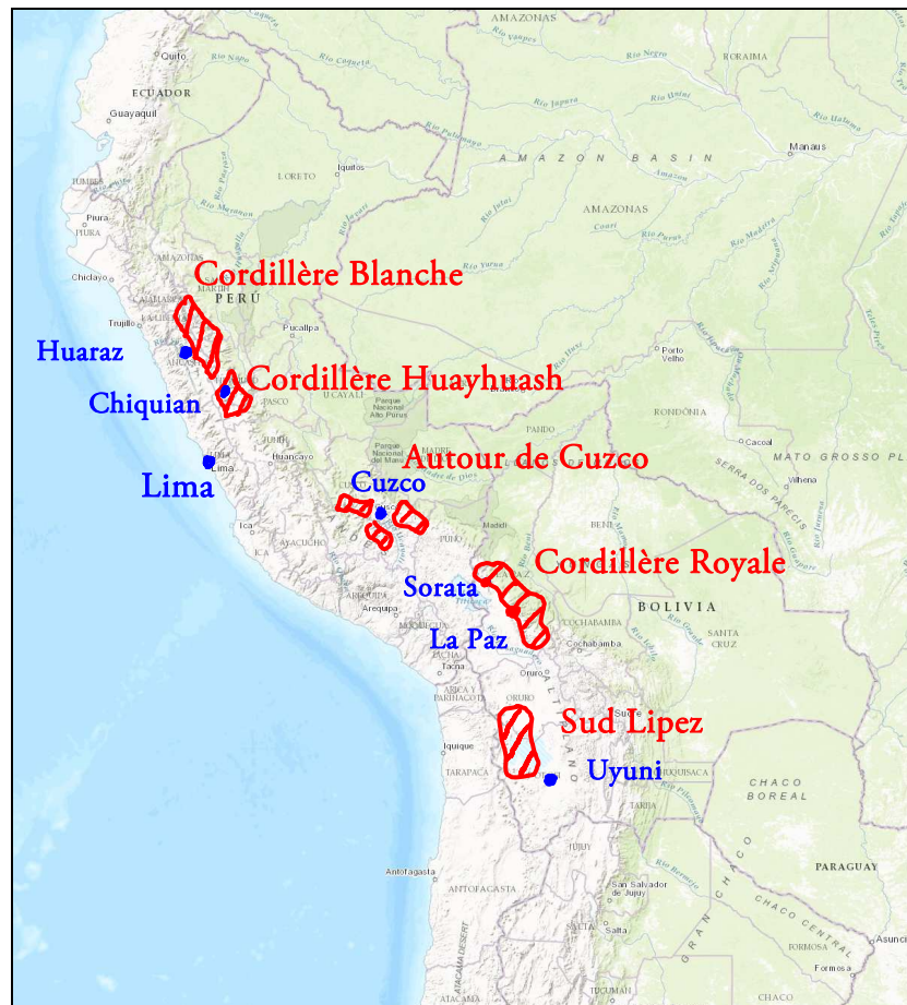
Vue d'ensemble des principaux massifs (cordillères) du Pérou et de Bolivie.

On propose ici un parcours du nord au sud des Andes Centrales, en mentionnant de manière non exhaustive les principaux massifs montagneux.