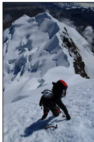
Durant la traversée des Illimanis