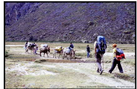
Trek d'approche en Cordillère Blanche. L'usage des mules facilite le portage.