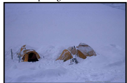
La météo est réputée stable mais des perturbations peuvent pénétrer le massif, même durant l'hiver austral.